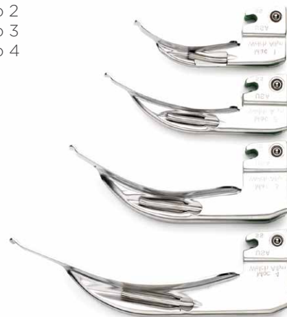
Lâminas de fibra óptica para laringoscópio, tipo Macintosh.